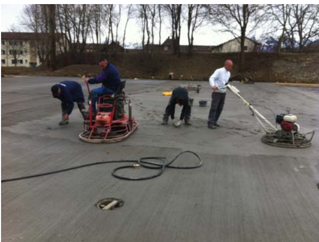
Betonieren inkl. Abtalschieren