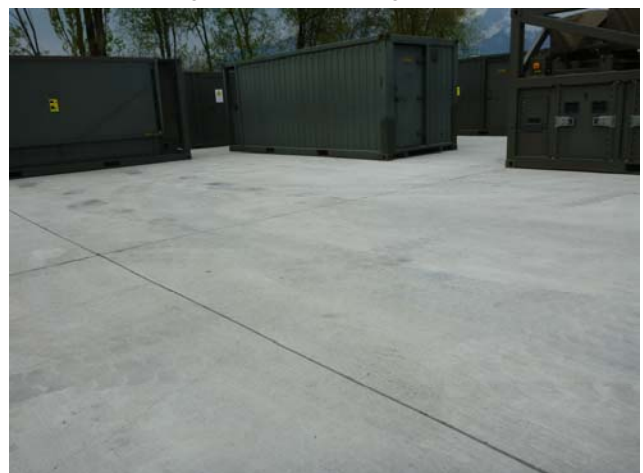
Ausschnitt erstellter Betonplatz