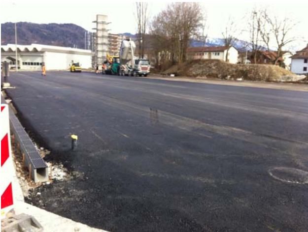
Einbau Fundamentsschicht 80 mm ACF 22

Besonderes: - Durchführen eines militärisches Plangenehmigungsverfahrens (MPV) - Grossflächige Betonplätze mit entsprechender Dilatation - Platzentwässerung in neu zu erstellende Versickerungsmulden - Erhöhte Beanspruchung durch Lastwagen und Raupenfahrzeuge