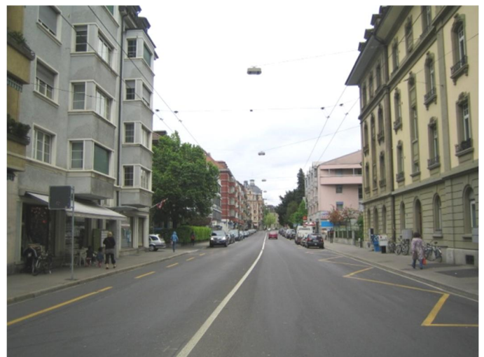
Länggassstrasse heutiger Zustand